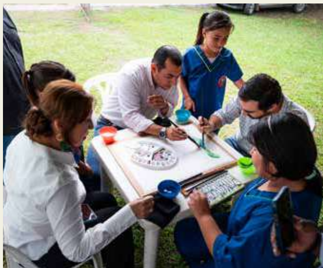
COLABORADORES DE Providencia compartieron con los estudiantes de las instituciones educativas beneficiadas mediante actividades lúdicas.