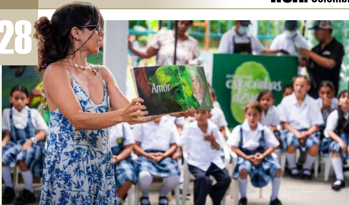
DURANTE LOS actos de entrega se realizaron actividades de lectura con los niños de las instituciones.