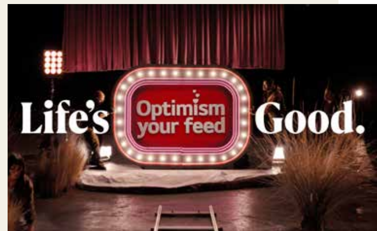
LA INTENCIÓN de la compañía es generar interacción con contenido inspirador.

La lista de reproducción “Optimism your feed” se puede encontrar en el canal global de TikTok de LG (@lge_lifegood) y en el canal global de YouTube (@LGGlobal), y más adelante se difundirá en varias plataformas de redes sociales a través de colaboraciones con influencers de todo el mundo.