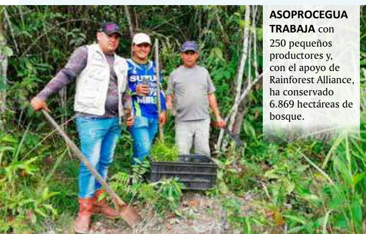
ASOPROCEGUA TRABAJA con 250 pequeños productores y, con el apoyo de Rainforest Alliance, ha conservado 6.869 hectáreas de bosque.

La Federación Campesina del Cauca (FCC), fundada en 1971, apoya a pequeños productores de café y garantiza ingresos justos. La cooperativa obtiene café orgánico y de Comercio Justo de unos 480 agricultores, más del 30% de los cuales son mujeres.