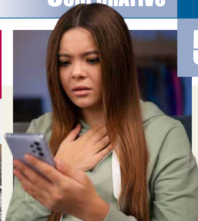
CADA VEZ más las redes sociales son una fuente de ansiedad.

LG QUIERE apalancar cambios positivos en las personas.