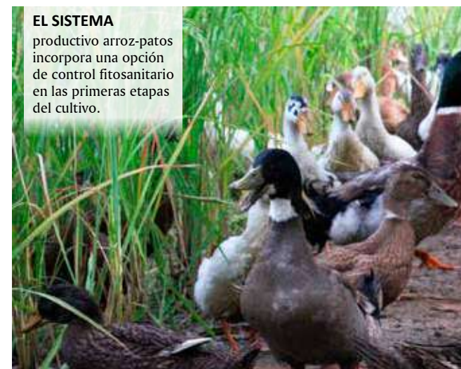
EL SISTEMA productivo arroz-patos incorpora una opción de control fitosanitario en las primeras etapas del cultivo.

Fedearroz ha implementado programas y plataformas tecnológicas que mejoran la producción, protegen la biodiversidad y promueven la salud del suelo