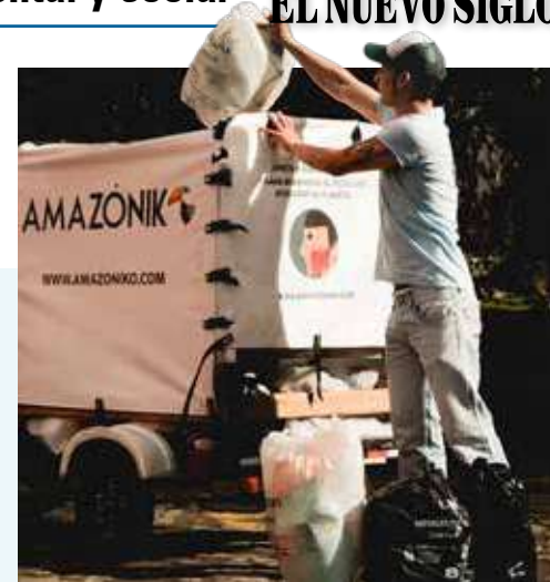
AMAZÓNICO ENSEÑA a sus usuarios a clasificar y preparar materiales para su reciclaje.

La Fundación Hilo Sagrado , una empresa sin ánimo de lucro, preserva los conocimientos, la cultura y las tradiciones de las comunidades indígenas de La Gua-