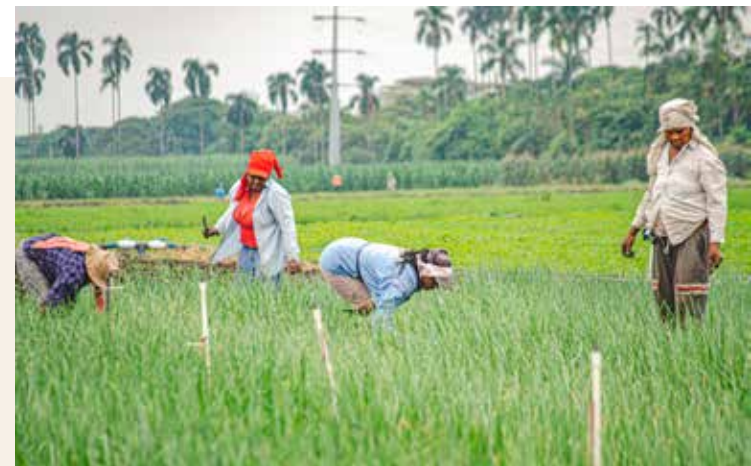
ESTA LÍNEA de créditos ofrece herramientas a las comunidades rurales para mitigar los efectos del cambio climático.