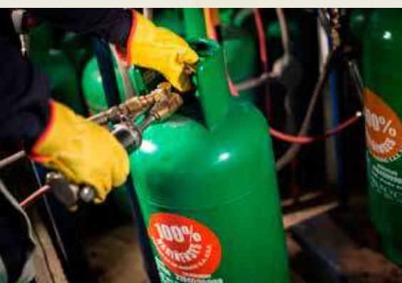
EL INCREMENTO en los precios del GLP afecta significativamente a las familias de los estratos 1 y 2, especialmente en zonas rurales.