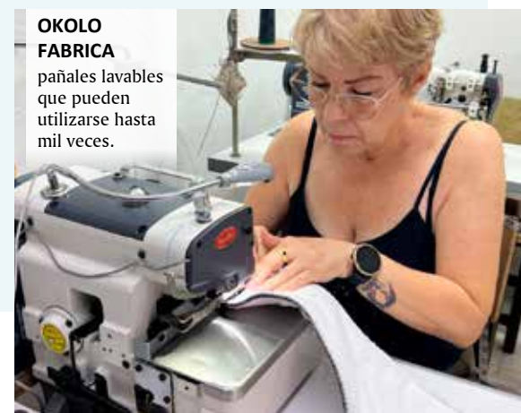
OKOLO FABRICA pañales lavables que pueden utilizarse hasta mil veces.