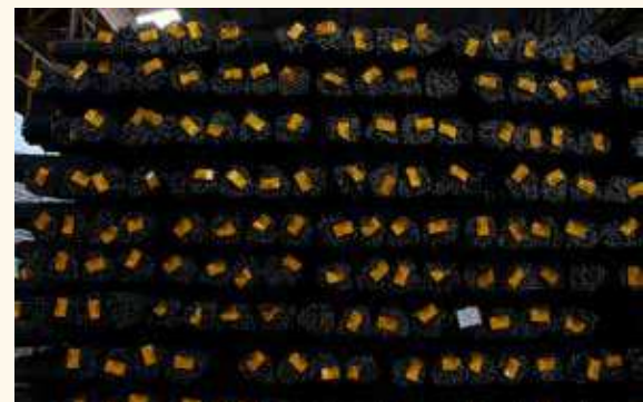
LA CHATARRA ferrosa se transforma en productos de acero que son la base de obras de construcción e infraestructura.

Gerdau Diaco, la mayor recicladora de chatarra ferrosa en el país, hace un llamado a los colombianos para que aumenten sus esfuerzos de reciclaje. “Al aumentar la conciencia sobre el valor estratégico de la chatarra y fomentar prácticas de reciclaje más eficientes y sostenibles, Colombia podría avanzar hacia un modelo de gestión de residuos más integral y responsable, lo que beneficiaría tanto al medio ambiente como a la economía