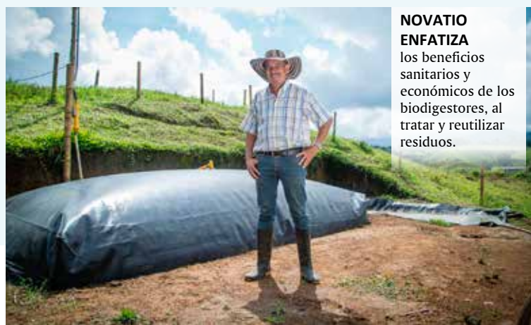
NOVATIO ENFATIZA los beneficios sanitarios y económicos de los biodigestores, al tratar y reutilizar residuos.