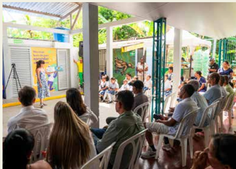
ESTUDIANTES, DOCENTES y comunidad celebraron la inauguración de estos espacios educativos.