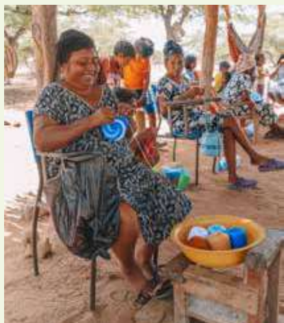
MÁS DE 150 mujeres wayuu de 11 comunidades se benefician de la feria.

La mayor motivación para ser parte de este festival es dignificar los ingresos de las mujeres tejedoras de las comunidades de La Guajira. Ya conocemos muchas cifras alarmantes sobre la situación en La Guajira, como, por ejemplo, que de cada 100 niños solo cuatro tienen acceso a agua potable. Sin embargo, lo que no es tan conocido es que las mujeres, quienes son verdaderas artistas tejiendo con maestría ancestral, no son bien remuneradas. Estamos comprometidos a apoyar y fomentar la justicia económica y social