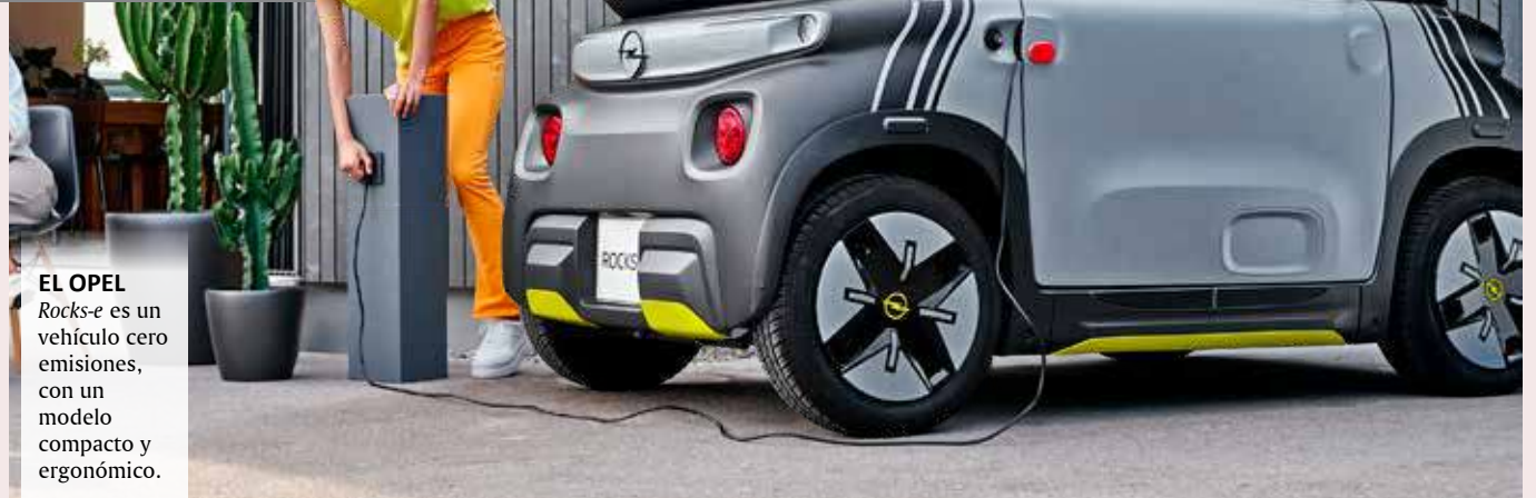
EL OPEL Rocks-e es un vehículo cero emisiones, con un modelo compacto y ergonómico.

ción en Rappi (Farmacia, Tiendas, Licores, Supermercado, Mascotas, Rappi Travel, Rappi Favor y Cajero ATM).