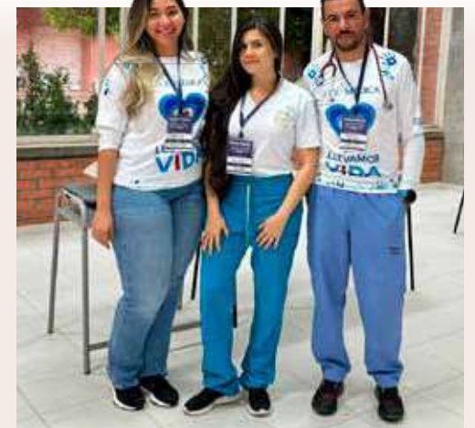
LA ALCALDÍA y el Hospital de La Gloria brindaron apoyo a esta iniciativa.

Teniendo en cuenta esta problemática, Hacienda La Gloria se unió a la Patrulla Aérea Civil Colombiana para llevar servicios de salud y tratamientos médicos a la población más vulnerable de La Gloria. Hacienda La Gloria es una empresa que se caracteriza por su sólido compromiso social y humano, y por eso cuenta con una política de desarrollo social, la cual se materializa a