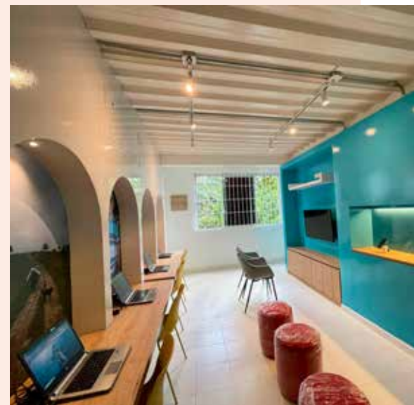
EL PRIMER Laboratorio Digital - Sala de Tecnología Claro por Colombia en El Paujil, funciona en la industria de lácteos La Maporita.

ESTE ESPACIO se logró gracias a una iniciativa que adelantan Bancamía, de BBVA; la actividad Finanzas para la Equidad, de Usaid, y Claro por Colombia.