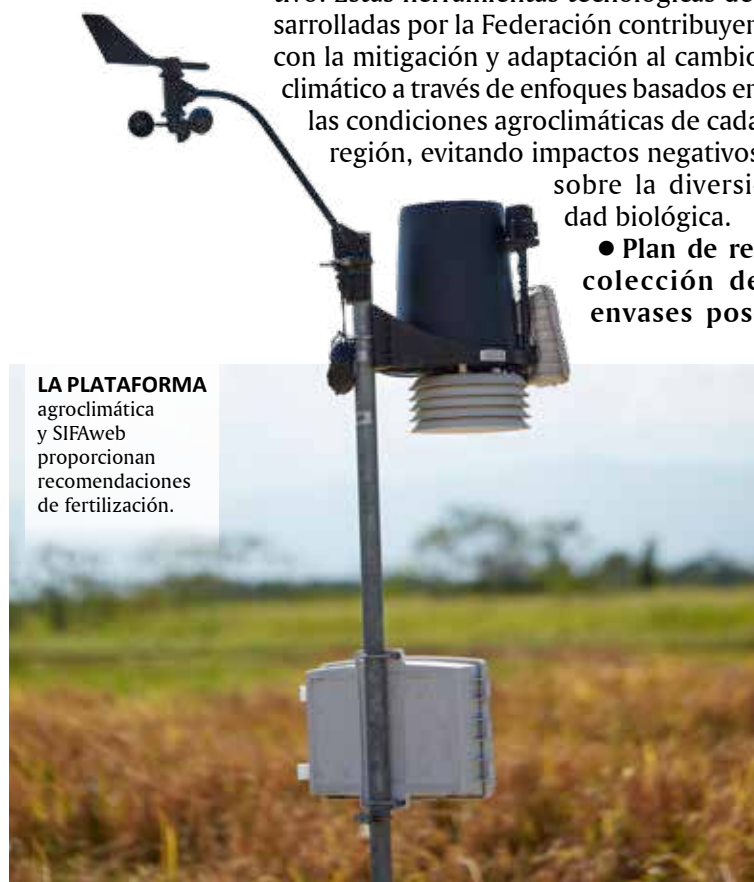
LA PLATAFORMA agroclimática y SIFAweb proporcionan recomendaciones de fertilización.

consumo de uso agrícola: Fedearroz se ha enfocado en no promover la comercialización de productos agroquímicos catalogados como de alta toxicidad; además, ha diseñado un Plan de recolección de envases posconsumo de uso agrícola, para su aprovechamiento y/o disposición final, así como de empaques o embalajes contaminados con agroquímicos. Esto contribuye con la reducción de la contaminación que pueda poner en riesgo las funciones de los ecosistemas y la salud humana.