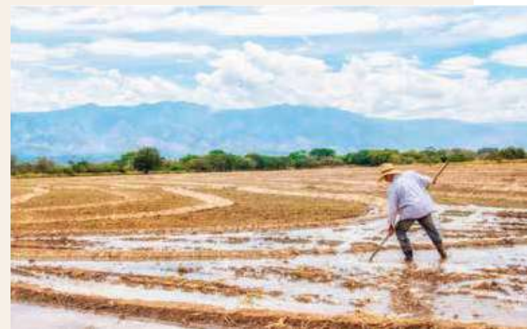
SE BRINDA un apoyo decidido a los productores del campo.