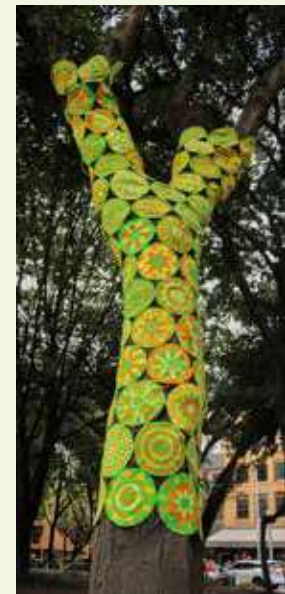
LA FERIA promueve el desarrollo social y económico sostenible para fortalecer el tejido social y mejorar la calidad de vida de las comunidades wayuu.

La solución no pasa solo por entregar un gasodoméstico a cada hogar, sino por entender la dinámica de estas comunidades y ofrecerles un energético como el GLP, que por su portabilidad puede llegar a muchas comunidades de La Guajira. El objetivo fundamental es que este energético llegue con un subsidio para incentivar su consumo y que este se mantenga en el tiempo. Aquí es donde es fundamental que existan políticas públicas y que esté en la agenda del gobierno local y nacional.