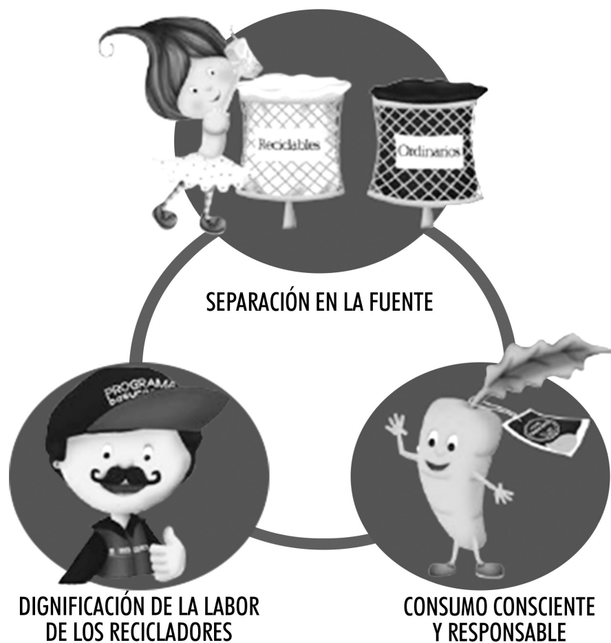
FIGURA 2. Relación entre actores