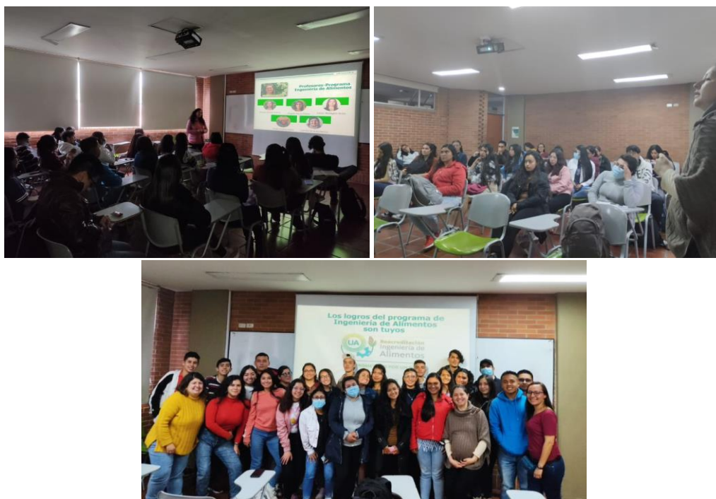
Figura 1. Fotografías primer etapa del Rally de Acreditación – Programa de Ingeniería de Alimentos

En dicha etapa se contó con la participación de 27 estudiantes, dentro de los cuales estaban los representantes de los diferentes semestres del programa y de los grupos participantes en el Rally. Se cuenta con un listado de asistencia (ver Anexo 1 ) y en la figura 1 se muestran algunas fotografías de la actividad.