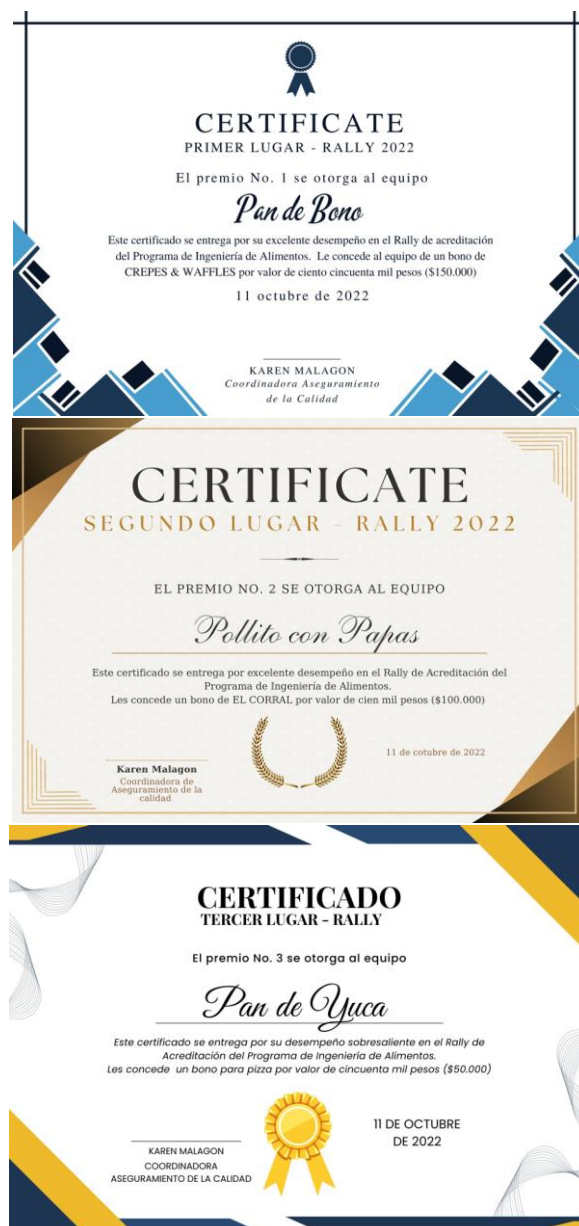
Figura 6. Certificados entregados a los equipos ganadores del Rally de Acreditación – Programa de Ingeniería de Alimentos

$150.000 para el primer lugar, un bono del Corral por valor de $100.000 para el segundo lugar y, por último, un bono de pizza por valor de $50.000. Además, se cuenta con actas de entrega de los bonos (Ver Anexo 8 ) y fotografías (Figura 7).