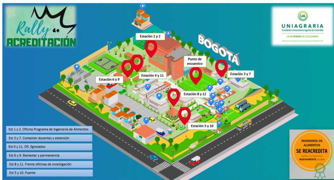
Figura 4. Mapa del Rally de Acreditación – Programa de Ingeniería de Alimentos