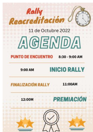
Figura 2. Agenda segunda etapa de Rally de Acreditación – Programa de Ingeniería de Alimentos

Para quienes no lograron asistir, fue enviado un correo masivo a todos los estudiantes con la presentación en formato .pdf (ver Anexo 2 ) junto con la agenda de la segunda etapa del Rally (Figura No. 2) y las reglas del mismo (Figura No 3) en una presentación corta (ver Anexo 3 ).