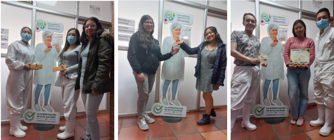
Figura 7. Entrega de bonos – premios del Rally de Acreditación

De forma general, se concluye que se contó con la participación activa de los estudiantes, realizaron equipos de diferentes semestres y programas académicos y revisaron en varias oportunidades los resultados del proceso de autoevaluación, dado que no podían usar dispositivos (celulares, tablets o portátiles) o pedir ayuda de docentes o administrativos en el momento de responder las preguntas por factor. Asimismo, los comentarios de los participantes fueron positivos y destacaron la actividad, como una forma dinámica e incluyente de dar a conocer los resultados obtenidos por Ingeniería de Alimentos.