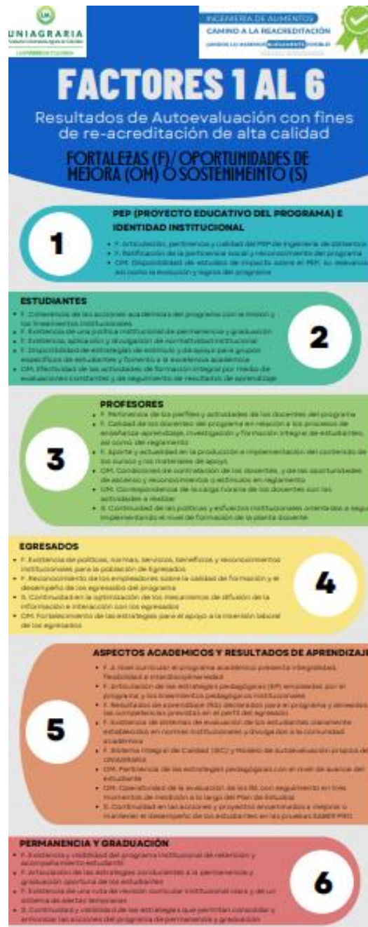
Figura 8. Infografía resultados de autoevaluación con fines de renovación de la acreditación de alta calidad del Programa de Ingeniería de Alimentos – Uniagraria

Finalmente, a los docentes se les enviara un correo masivo con infografías que resumen los resultados del proceso de autoevaluación 2021 – 2022. La figura 8 muestra un de las infografías, el archivo pdf está en el Anexo 9 .