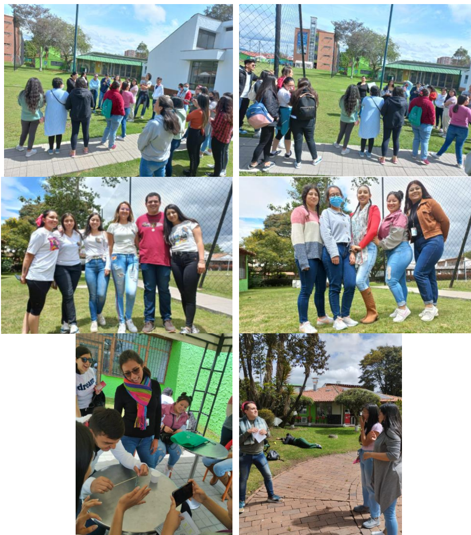
Figura 5. Fotografías etapa 2 Rally de Acreditación – Programa de Ingeniería de Alimentos

Primer lugar Pan de Bono Segundo Lugar Pollito con Papas Tercer Lugar Pan de Yuca