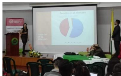
Rueda de negocios Estudiantes AFYS