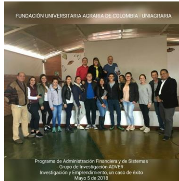
Grupo ADVER y Semillero VEA