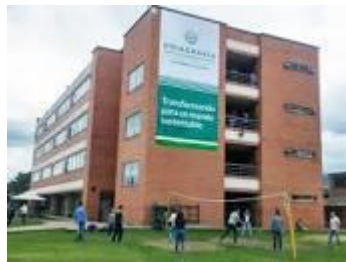
Edificio Fundadores Sede Calle 170