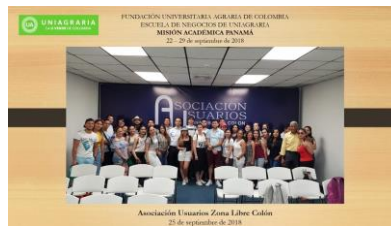
Misión Académica Internacional – Participación en cursos cortos