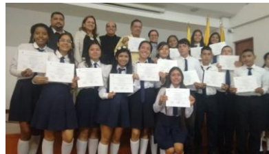
Proyecto extensión – INNOVAR – Tolima