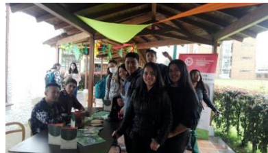
Estudiantes programas de AFYS