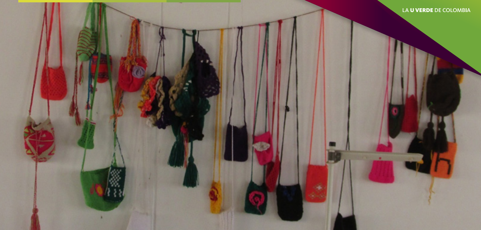
Mochilas Wayuú tejidas por las estudiantes de la institución etnoeducativa integral rural internado de Sipana.