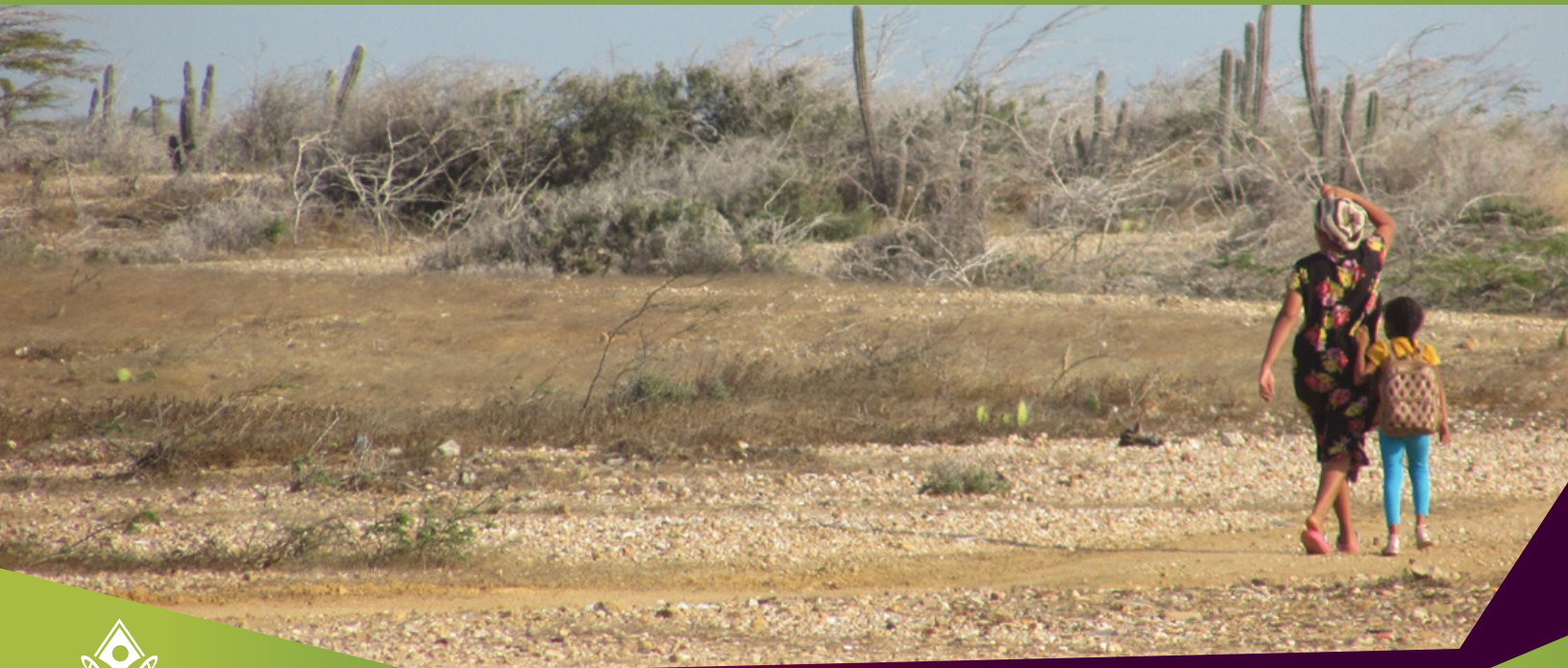
Madre y su hija caminando en la Flor de la Guajira