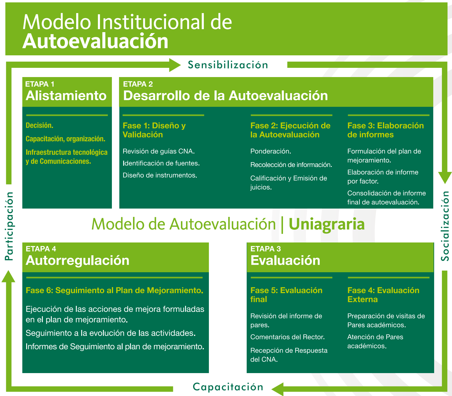
Figura 2. Modelo Institucional de Autoevaluación