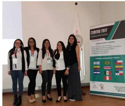
Participación de los estudiantes en eventos de investigación