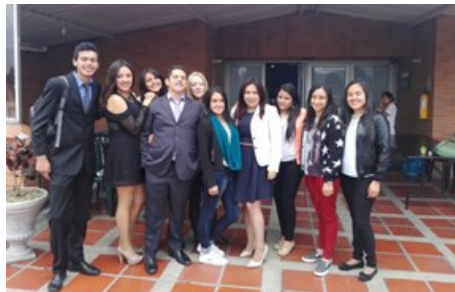
Estudiantes en práctica de Consultorio Contable