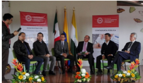
Participación del programa de contaduría en conversatorios