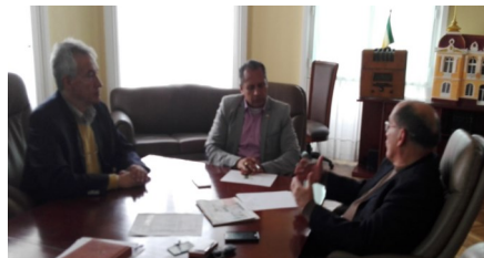
Gestión del Decano de FCEAYC y Director del programa en alcaldías