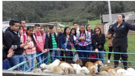
Visita a de los estudiantes al Centro de Investigación y Desarrollo Tecnológico CIDT "Pinares de Tenjo".