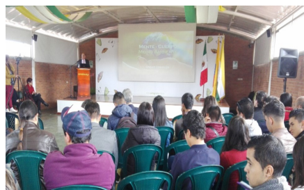
Estudiantes Programa de Contaduría Pública participando en actividades extracurriculares