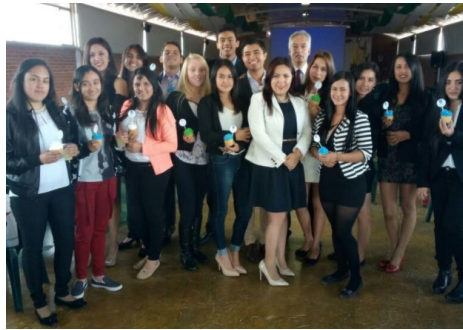
Estudiantes y Docentes Programa de Contaduría Pública