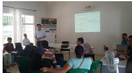
Capacitación Contable A Las Asociaciones Agropecuarias Del Municipio De Fuentedeoro - Meta, en el Centro de investigación, innovación social y transferencia tecnológica